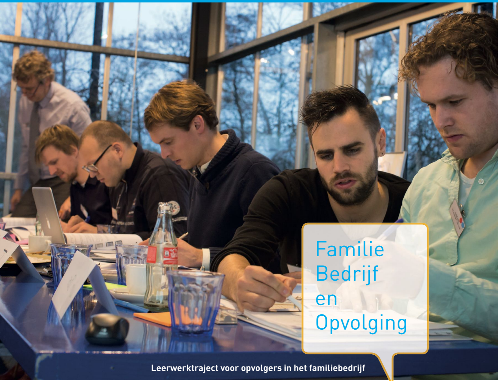
Leerwerktraject voor opvolgers in het familiebedrijf